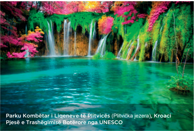
Parku Kombëtar i Liqeneve të Plitvicës (Plitvička jezera), Kroaci Pjesë e Trashëgimisë Botërore nga UNESCO