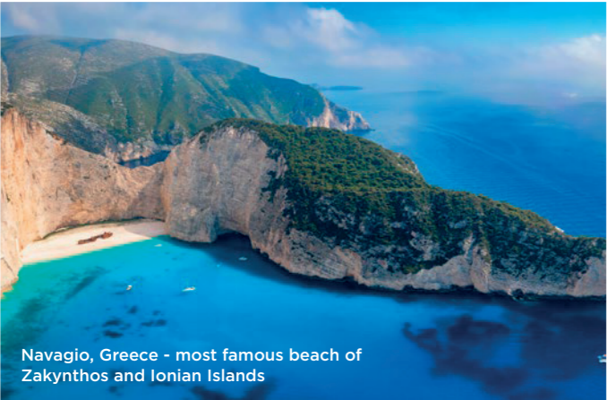
Navagio, Greece - most famous beach of Zakynthos and Ionian Islands