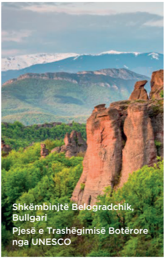
Shkëmbinjtë Belogradchik, Bullgari Pjesë e Trashëgimisë Botërore nga UNESCO